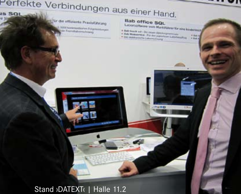
Stand DATEXT | Halle 11.2